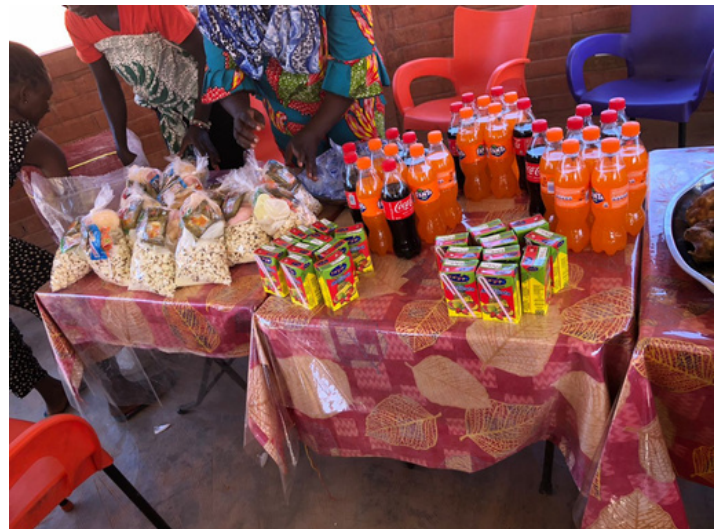
Photos de la fête du nouvel an au village Beog-Tienbo