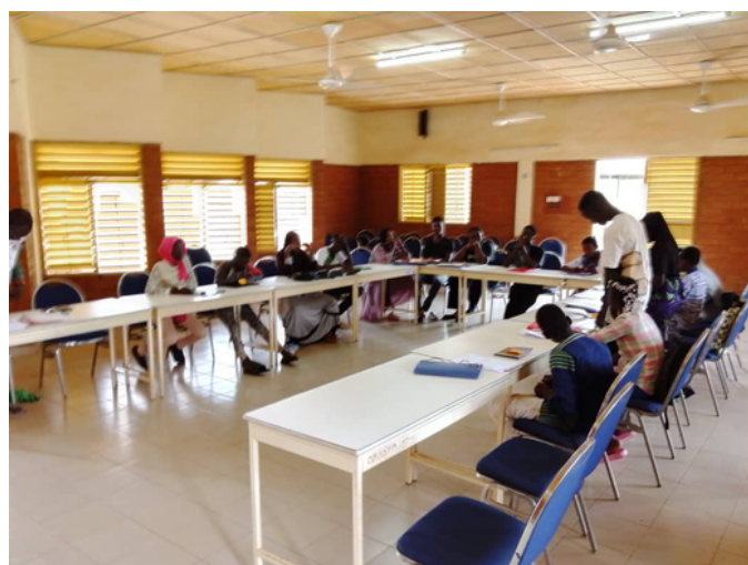
Photos des séances de clubs